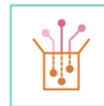
Data og datadeling