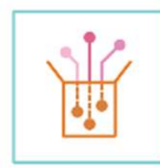
Data og datadeling